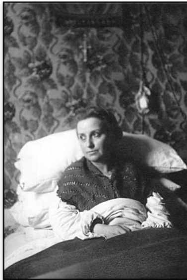
Maria Valtorta (1897-1961)

Quand on sait qu'Anne-Catherine Emmerich, autre mystique visionnaire de la vie du Christ, a été béatifiée cent quatre-vingts ans après sa mort, on se dit qu'il y a encore un petit peu de marge...