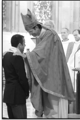
Le jour de notre Confirmation, en la Cathédrale d'Autun – le 7 juin 2014

Cet été-là, il n'était plus question de me rendre à Las Vegas, c'est à Lourdes que nous avons passé quelques jours en famille. Puis, je partis seul en pèlerinage à Medjugorje ( Bosnie-Herzégovine ). C'était pendant la coupe du monde de foot (2014), mais je me fichais royalement de ne pas voir les matchs à la télé. Une nouvelle fois, la Providence s'était chargée de tout organiser... Nous ne disposions pas de l'argent nécessaire pour financer ce pèlerinage. J'avais donc demandé à la Sainte Vierge de bien vouloir m'aider. Je ne doutais pas que si Marie m'invitait vraiment à me rendre à Medjugorje, elle trouverait bien une solution pour m'y aider. C'est effectivement ce qu'il s'est passé.