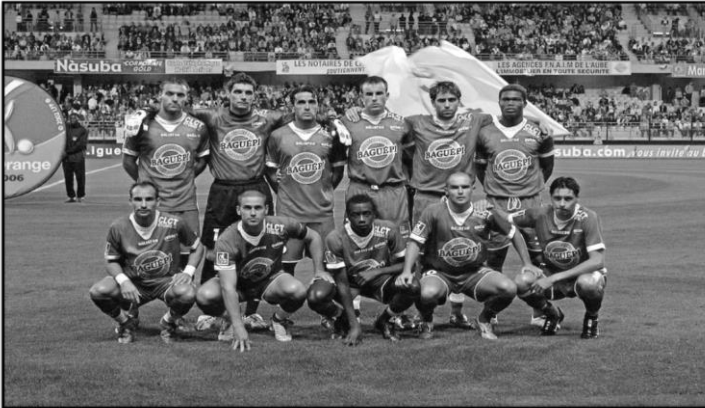
ESTAC Troyes 2005-2006 (le 4ème en haut de gauche à droite)

pour moi incohérent de me marier devant un Dieu auquel je ne croyais pas... En rencontrant Jésus quelques années plus tard, nous comprendrions comme nous avons bien fait.