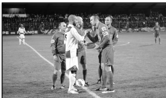
Match de coupe de France avec le FC Montceau / Janvier 2013