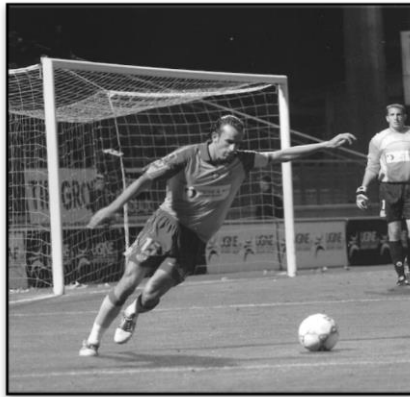
FC Gueugnon / 2004-2005

La première partie 2 de saison se déroula encore mieux que j'avais osé l'espérer. Notre équipe obtenait de très bons résultats, j'étais l'un des joueurs les plus en vue du championnat. Tout me réussissait, j'étais souvent très performant, il m'arrivait même de marquer quelques buts importants. Comme mon contrat se terminait en fin de saison, les sollicitations commençaient à affluer. Plusieurs agents 3 avaient flairé la bonne affaire... Ils me contactaient et me proposaient de collaborer. A les écouter, une belle carrière m'était promise, de nombreux clubs de Ligue 1 songeraient sans doute à me recruter.