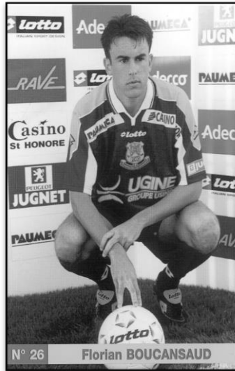
FC Gueugnon / 2000-2001

Grenoble-FC Gueugnon (29/09/2001) - Match nul 0-0.