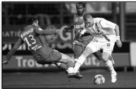
Lyon / Décembre 2008