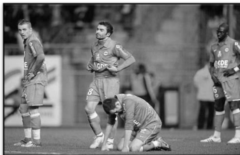
Lille / Mars 2009