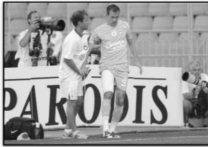
Monaco-Caen / Août 2008